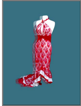
شكل رقم (٣) أمام

شكل ٣ أمام فستان من الدانتيل ببطانة من الستان الأبيض بحزام من على الوسط وطبقات بكشكشة من أسفل بخطوط مائلة شكل ٣ خلف نفس الفستان والخلف أطول