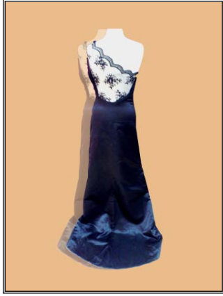
شكل رقم (٤) خلف

شكل ٤ أمام فستان من الستان الأزرق بدرابيهات على الصدر من الجهة اليمنى وحماله على الجهة اليسرى فقط شكل ٤ خلف نفس الفستان والخلف أطول من الأمام قليلا، بحماله دانتييل من الجهة اليسرى، منتهية بقصة عند خط الوسط