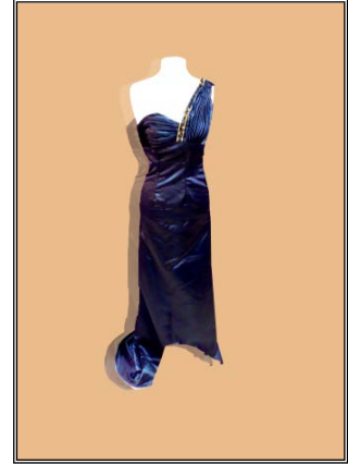
شكل رقم (٤) أمام

شكل ٤ أمام فستان من الستان الأزرق بدرابيهات على الصدر من الجهة اليمنى وحماله على الجهة اليسرى فقط شكل ٤ خلف نفس الفستان والخلف أطول من الأمام قليلا، بحماله دانتييل من الجهة اليسرى، منتهية بقصة عند خط الوسط